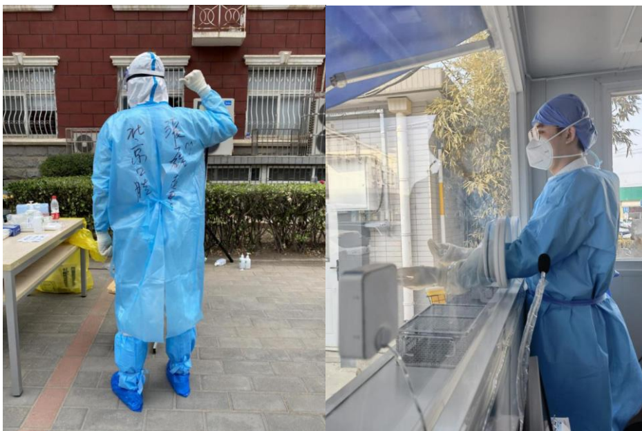
作者跟随北京口腔医院核酸采样队伍执行采样任务。